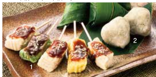
京都「麩房老舗」①生麩の田楽 (5本入) 税込648円 ②麩まんじゅう (5個入) 税込1,080円

お買い得!! あす11日火 初日サービス 紀州南高梅 和み梅 (250g) (50セット限り) 税込864円