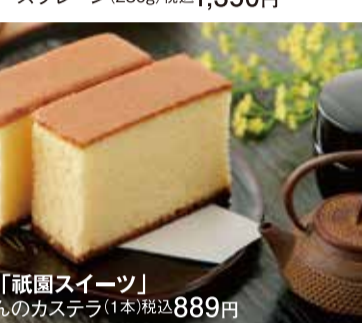
京都「祇園スイーツ」 ぎおんのカスタード (1本) 税込889円