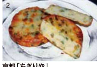
京都「ちぎりや」 ①京ポークしゅうまい (6個入) 税込972円 ②すり身揚げ九条ねぎ (1個) 税込351円