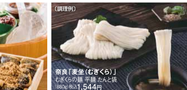
奈良「表坐 (むぎくら)」 むぎらの麺 平麺 たんと袋 (880g) 税込1,544円