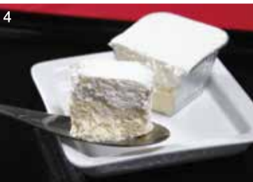
神戸「アマリア」③神戸カタラーナ (165g) 税込864円 ④アマリアチーズプレーン (280g) 税込1,350円