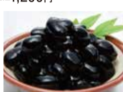
京都「ふたたび食品」 丹波黒豆 煮豆 (100g) 税込756円

お買い得!! あす11日火 初日サービス わかめ煮椎茸 (300g) (50セット限り) 税込1,080円