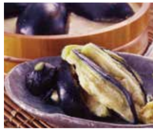
大阪「伊勢屋商店」 水茄子 (浅・ぬか) 漬 (1個) 税込540円