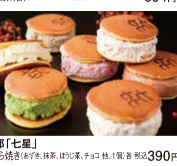
京都「七星」 生どら焼き (あずき、抹茶、ほうじ茶、チョコ 他、1個) 各 税込390円