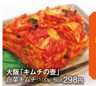
大阪「キムチの壺」 白菜キムチ (100g) 税込298円