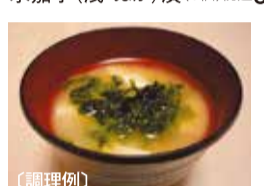
大阪「未来」 あおさ (25g) 税込1,260円

お買い得!! あす11日火 初日サービス 京佃煮4品 (お茶ちりめん、角切山椒昆布、 しじみしぐれ、しぼきくらげ) (80セット限り) 税込1,080円