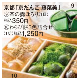
京都「京だんご 藤菜美」 ⑨茶の露ほろり (1個) 税込350円 ⑩わらび餅3色詰合せ (1折) 税込1,250円