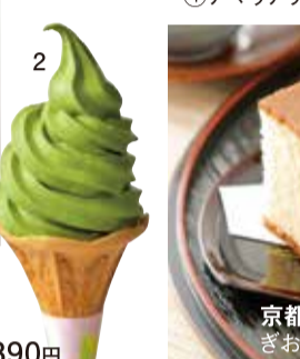
京都「京都・東山茶寮」 ①宇治抹茶ぜんざいゼリーパフェ (1杯) 税込648円 ②宇治抹茶ソフトクリーム (1個) 税込390円