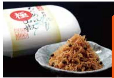
京都「京佃煮 野村」 極ちりめん山椒 (70g) 税込1,200円

お買い得!! あす11日火 初日サービス 京佃煮4品 (お茶ちりめん、角切山椒昆布、 しじみしぐれ、しぼきくらげ) (80セット限り) 税込1,080円