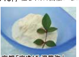
京都「京ゆば 湯葉弥」 くみあげ湯葉 (5枚入) 税込1,296円