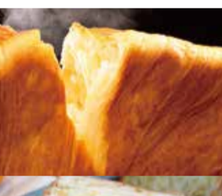
京都「ANDE (アンデ)」 ③プレーンデニッシュ 2斤 税込1,080円 ④オレンジデニッシュ 1斤 税込1,080円

※天候不良や交通事情等により、入荷が遅れたり販売を中止する場合がございますのであらかじめご了承ください。※一部所在地外の産地の素材を使用した商品もございます。※商品は豊富に取り揃えておりますが、品切れの際はご容赦ください。※写真は一部、盛りつけなどのイメージもございます。本催事で販売する商品については、大丸松坂屋カードのポイント、大丸松坂屋お客様ゴールドカードのご優待は対象外でございます。