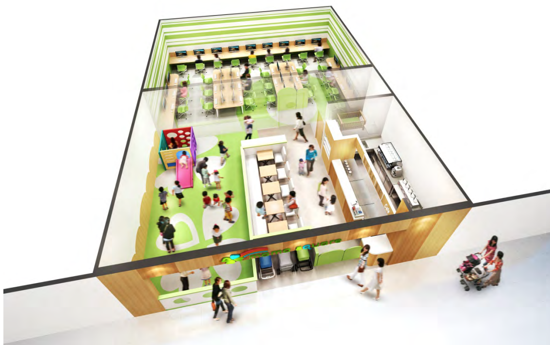
キッズスペースを併設するワーキングスペース