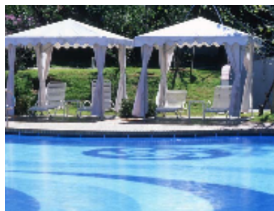
プライベートキャビン「カバナ」