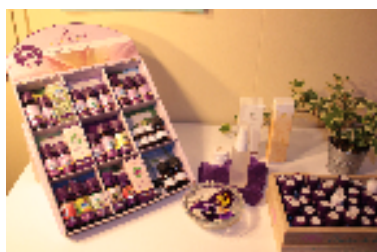
ヨーロッパ製の精油 イメージ

※上記料金は、いずれも1室料金、税金込みの料金です。 ※朝食付はプラス1,000円でご用意いたします。