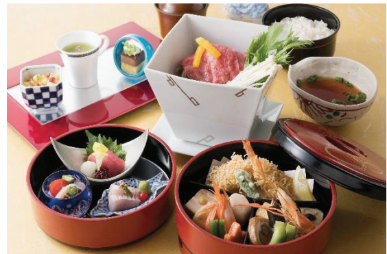
黒毛和牛蒸ししゃぶご膳 3,800円（税別）