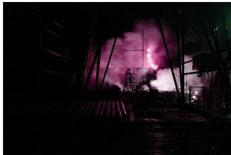
「泉源ライティングインスタレーション」