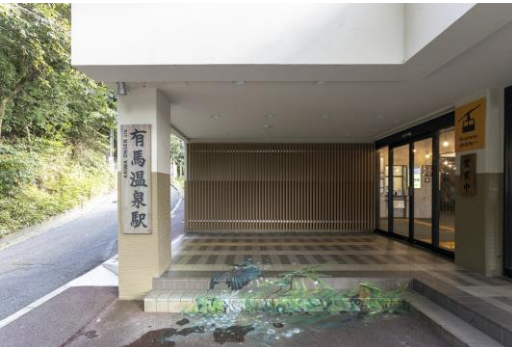
⑤ 松本 かなこ氏作品