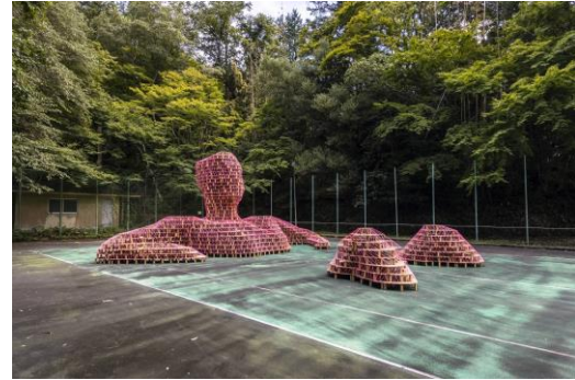
④ 木村 剛士氏作品