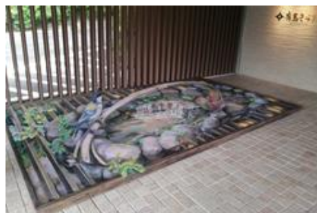
「有馬きらり」前 松本 かなこ氏ペイントアート