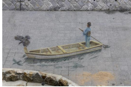
② 松本 かなこ氏作品