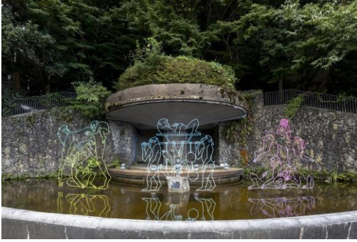
① 久保 寛子氏作品