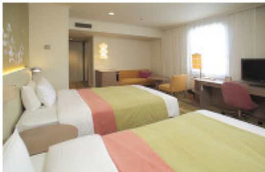
コーナーツインルーム(エキストラベッド対応可)