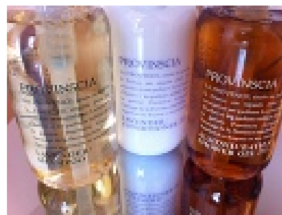
客室リニューアルに伴いバスアメニティも一新

※料金は1室、サービス料・消費税・宿泊税込 (宿泊税)東京都の条例により、ご宿泊料金が¥10,000 以上の場合 1名様¥100、¥15,000 以上の場合 1 名様¥200 の宿泊税がかかります。