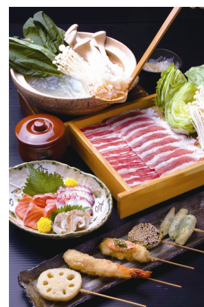
串かつ・鍋「小枝日和」料理イメージ