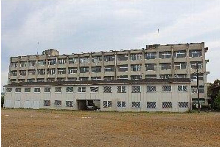
旧 埼玉県立毛呂山高等学校