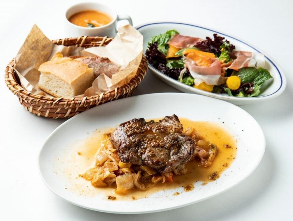
メインランチ 2,200円 「群馬ポークのロースト キャベツのラグー」

[DINNER] コックにとっては理想的な環境である豊かな食材あふれる淡路島で、食材の魅力を引き出す美味しさを追求し、島内の食材を使ったトラットリアメニューを提供します。