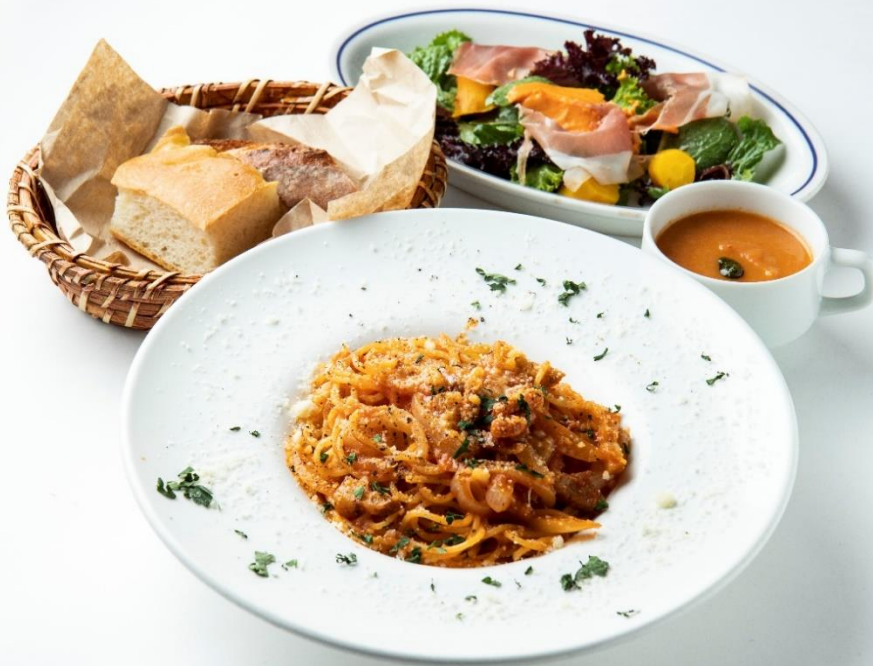
パスタランチ 1,500円 「アマトリチャーナ キタツラ」