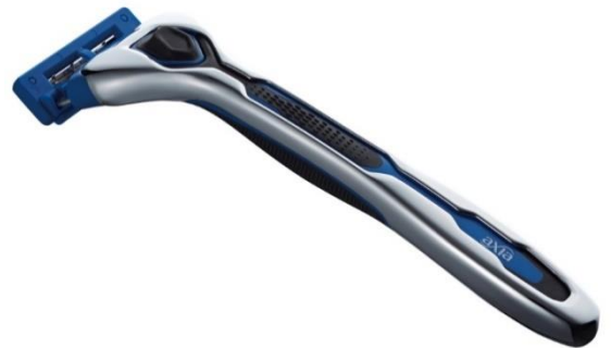
シルクプロテイン配合スムーザー

刃には貝印独自技術とコーティングを施し、スパッと剃れて、やさしい剃り心地も兼ね備えた5枚刃を採用。また、刃体のサスペンションアームが、肌の負担をさらに軽減しています。