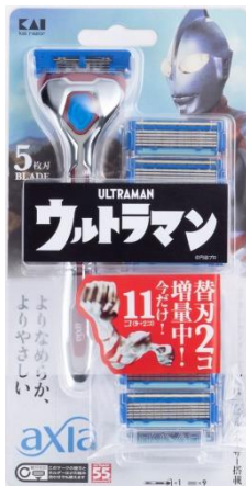
KAI RAZOR axia バリューパックスリム ウルトラマン 価格：2,000円（税込2,200円）