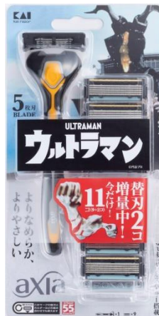
KAI RAZOR axia バリューパックスリム ゼットン 価格：2,000円（税込2,200円）