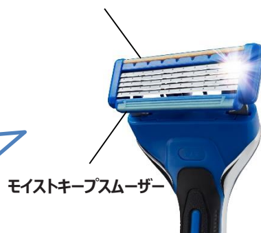
モイストキープスムーザー