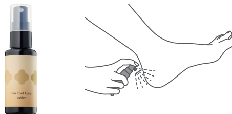
使用アイテム：プレフットケアローション

かかとにプレフットケアローションを約3プッシュ吹きかけ、かかとの角質に浸透させます。