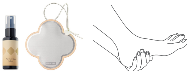
使用アイテム：プレフットケアローション、フットスモーサー

お手入れの最後に、プレフットケアローションをかかとに吹きかけ、フットスモーサーの粗目面でくるくると円を描くように磨きます。最後に細目面（KOBAKOのロゴが付いている面）を使ってしっかり磨くと、よくなめらかで、ふっくらとしたかかとに仕上がります。