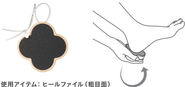
使用アイテム：ヒールファイル（粗目面）

かかとが乾燥した状態のまま、ヒールファイルの粗目面（お花型のマークがない面）で円を描くように硬いかかとの表面を粗削りし、プレフットケアローションをかかとの角質に浸透しやすくします。