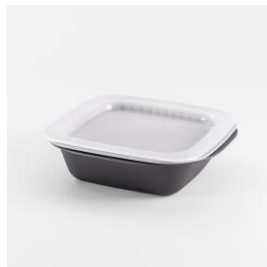
クッキングコンテナ