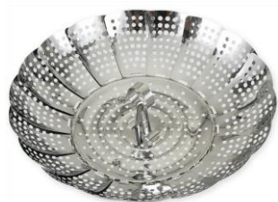
ステンレス フリーサイズ蒸し器 18～24cm用

※4 参考：クックパッド https://static.cookpad.com/campaign/foodtrend/