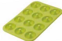
KHS シリコンミニドーナツ型 12個取ベーシック