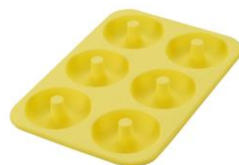
KHS シリコンドーナツ型 6個取ベーシック

※5 自社出荷実績より数量前年比。期間：2024年1月～9月、2025年1月～9月の国内出荷分