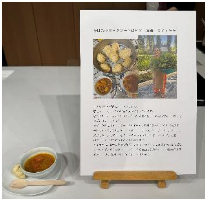
ラダックフードのピン(春雨)とティモモ