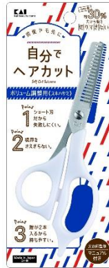
セルフ用スキハサミ 価格：1,400円（税抜） /1,540円（税込）