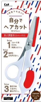
セルフ用カットハサミ 価格：1,200円（税抜） /1,320円（税込）