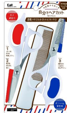
セルフ用散髪セット 価格：2,500円（税抜） /2,750円（税込）