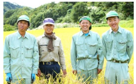
越後ファームの皆さん

また、洗う時は軽く混ぜたら水を捨てる事を2～3回繰り返してください。昔に比べ精米技術が進化しているので、ゴシゴシこすらないのが美味しさの秘訣。白濁していても問題ありません！