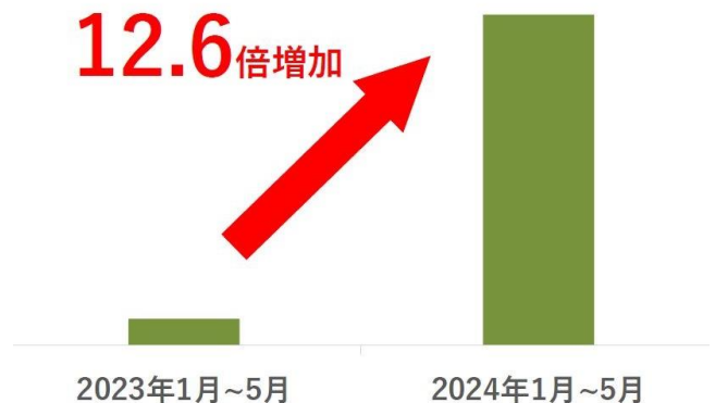
石川県への寄付件数推移

2024 年 1 月の能登半島地震で被害を受けた石川県への 1 月～5 月の寄付額は、昨年同期比 12.6 倍に増加しており、多くの寄付者が応援・支援を目的に寄付先として選んでいることが分かります。被災地で作られたお礼品を贈り物にすることで、復興に向けたお礼品事業者への支援にもつながります。