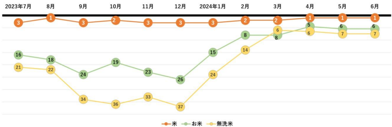
検索キーワードランキング推移

さらに、「さとふる」における検索キーワードのランキングでは、「米」が常に5位以内にランクインしています。そのほか、「お米」や「無洗米」といった関連ワードも順位を上げており、不作による市場価格の値上がりから、ふるさと納税を活用する動きが高まったと考えられます。なかでも「無洗米」は、検索キーワードランキングにおいて2024年1月以降に順位を上げており、「無洗米」カテゴリの寄付件数も前年同期比約2.9倍に伸びていることから、能登半島地震の発生を受けて、万が一の断水に備える人が増えたと推察されます。