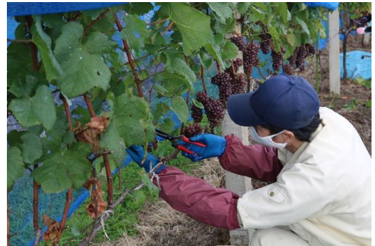
奥尻町のワインづくりの様子

北海道奥尻町は北海道の南西端に位置する、周囲 84km の日本海に浮かぶ離島です。そんな奥尻町では、2008 年に日本初の離島ワイナリーである「奥尻ワイナリー」が創業されました。現在、町ではふるさと納税限定ワインを造る取り組みが進められています。なかでも、 ワインに使用するラベルデザインは、2024 年 12 月初旬に地元高校生を対象にデザインコンペを行い、応募のあった 11 件の中から選ばれます。 ふるさと納税では、2025 年 4 月からの取り扱いを予定しています。