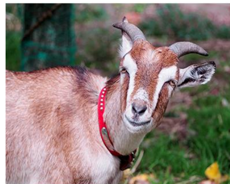
農縁に泊まろう(大人1名様) [福島県須賀川市]