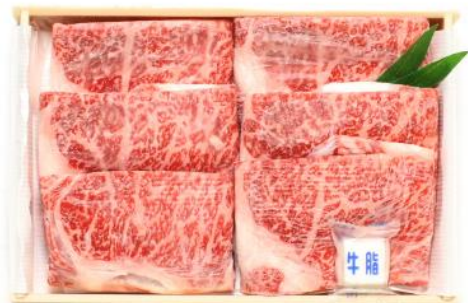
【小町の里・幸牛】黒毛和牛すき焼き肉 [福島県小野町]