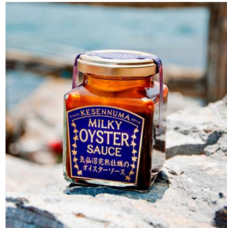
気仙沼完熟牡蠣のオイスターソース [宮城県気仙沼市]