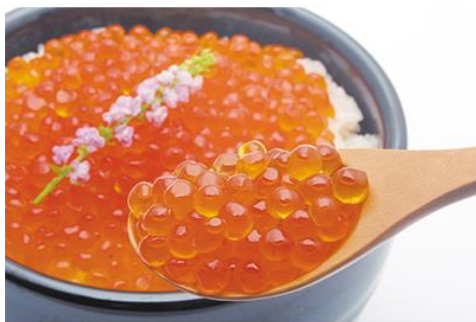
三陸産高級いくら [岩手県釜石市]