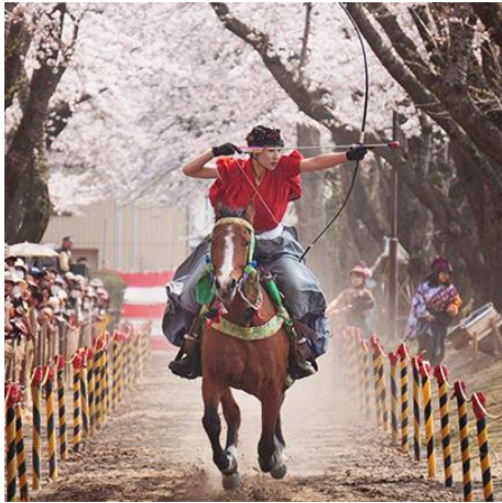
流鏝馬体験プログラム 90分 [青森県十和田市]