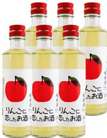
桃川 りんごに恋したお酒 [青森県おいらせ町]