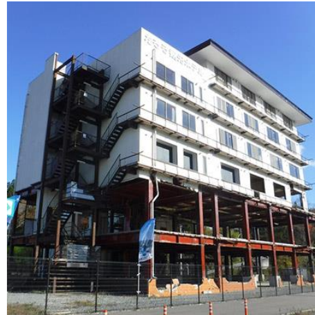
【学ぶ防災・宮古市田老地区】 津波遺構案内 1時間コース [岩手県宮古市]