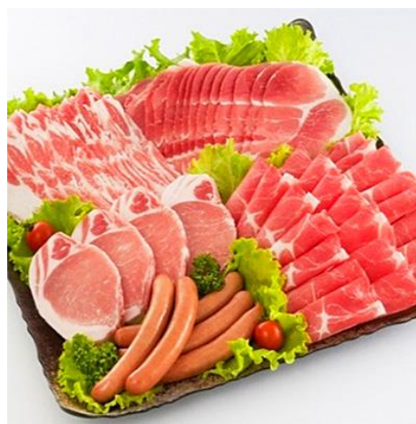
【のし付】【ファームヨシダ】えこるとん・ 豚肉5種計1160g・バラエティーセット