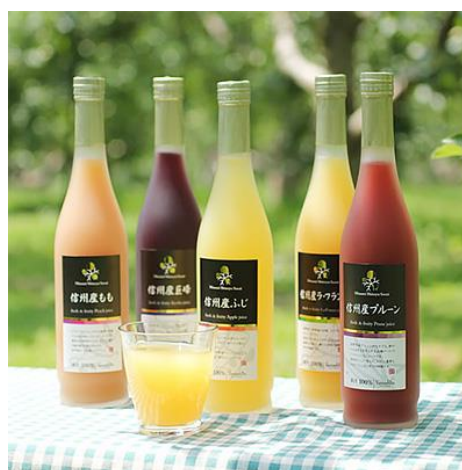
【のし付き】信州産 果汁100% くだものジュース 500ml×5種各1本