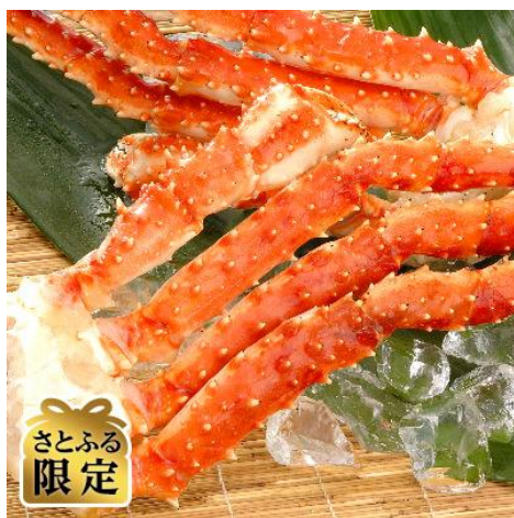
さとふる限定【のし付】 【1.5kg サイズ】ポイルタラバガニ足