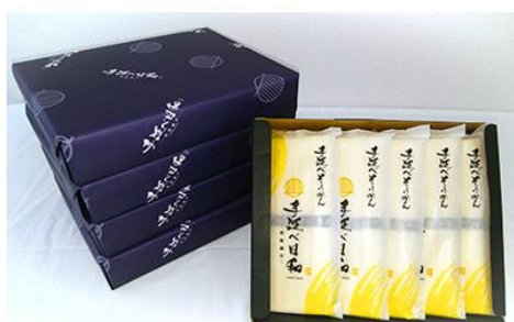
【のし付き】島原手延べそうめん手延べ日和 (5束袋×5袋入り化粧箱)×5箱