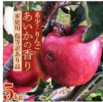
【傷等訳あり】甘い!希少!りんご

掲載ページ： https://www.satofull.jp/products/detail.php?product_id=1109778