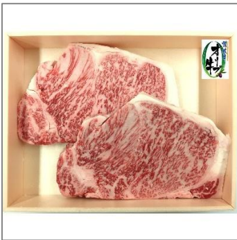
＜コロナ支援＞オリーブ牛