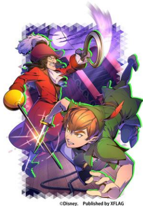
限定★5カード 「【みんなを守れ！ 船上の決闘】ピーター・パン&フック船長」