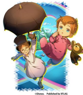
限定★4カード 「【ネバーランドの来訪者】ジョン&マイケル」 ※イベントボーナス効果あり