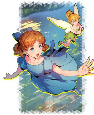
★4 カード 「【妖精のあとを追って】 ティンカー・ベル&ウェンディ」 ※イベントボーナス効果あり

各カードのステータスやゲーム内イベントの詳細は、公式サイト内「NEWS」にてご確認ください。 『スタースマッシュ』公式サイト： https://star-smash.jp