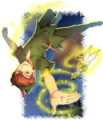
★5 カード 「【真夜中の来訪者達】 ピーター・パン&ティンカー・ベル」 ※イベントボーナス効果あり