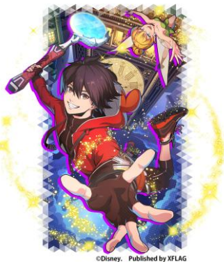
限定★5カード 「【星夜のレヴィテーション】ユウ&ティンカー・ベル」