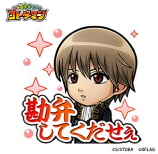
沖田総悟 CV: 鈴木健一

■TV アニメ『銀魂』にまつわるクイズを出題する「銀魂ドリル」が特設サイト内に登場！問題をシェアした方の中から抽選で「コラボ特製ジオラマアクリルスタンド」をプレゼント！