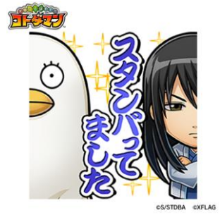
桂小太郎 & エリザベス CV: 石田彰