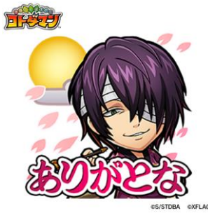
高杉晋助 CV: 子安武人