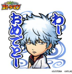
坂田銀時 CV: 杉田智和