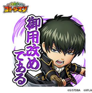
土方十四郎 CV: 中井和哉