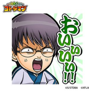
志村新八 CV: 阪口大助