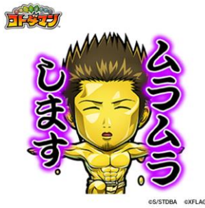
近藤勲 CV: 千葉進歩