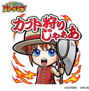
神楽 CV: 釘宮理恵