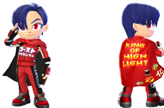
▲キングオブハイライト賞でもらえる限定キセカエパーツ