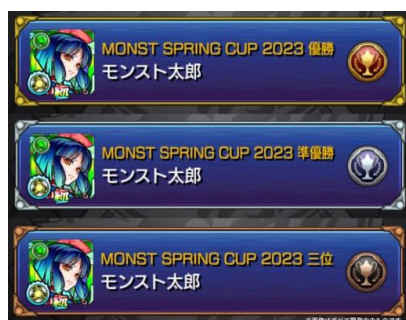
▲モスト内で使える入賞者オリジナルの「称号」