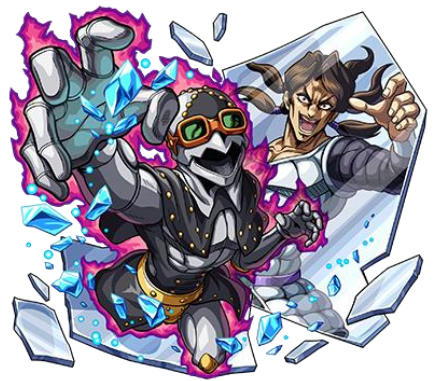
火属性 ★5 暗殺者チームのメンバー ホルマジオ (進化) CV：福島潤