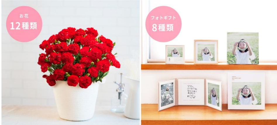
お花とフォトギフトを自由に組み合わせられる

定番のお花とフォト商品のギフトセットは、12 種類のお花と 8 種類のフォトギフトから自由に組み合わせが可能です。また、三越伊勢丹限定商品の人気スイーツと紅茶セットのほかに、みてねオリジナルの靴下やハンカチもギフトセットとしてお贈りいただけます。