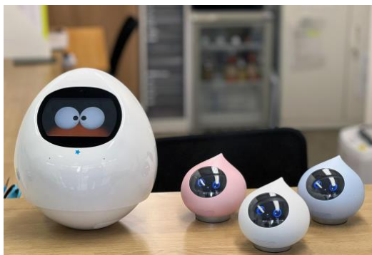
▲ロボット療育に用いられるコミュニケーションロボット「Tapia (タピア)」(左)と「Romi」(右)。