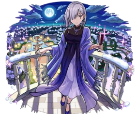
闇属性 ★6 パーティへの列席 フィオナ・フロスト (進化) CV：佐倉綾音