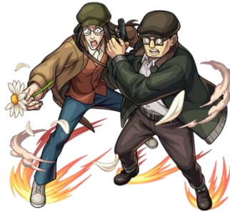
ボンド・フォージャー (守護獣) CV：松田健一郎