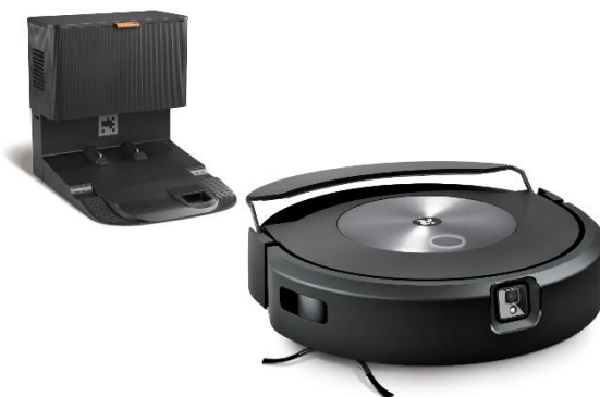
掃除機 & 床拭きロボット「ルンバ コンボ j7+」

今後もアイロボットは「暮らしを、もっとあなたらしく。」というスローガンのもと、さらに充実した製品やサービスを提供することで、人々の暮らしを豊かにする Empower people to do more というミッションを、世界中のスタッフがー丸となってこれからも取り組んでまいります。