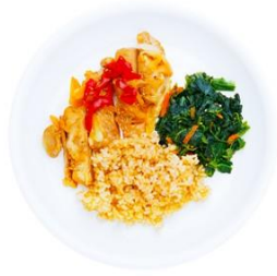
[TOSHI] カオマンガイセット