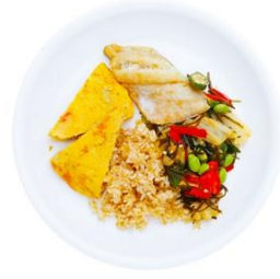
[AKI] タラの塩昆布焼きセット