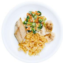
[YUKO] 鯖の塩焼きセット