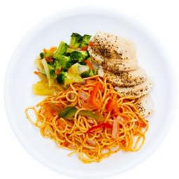
[YUKO] 鶏ハムとナポリタンセット