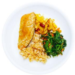
[TOSHI] 鮭のカレー風味セット