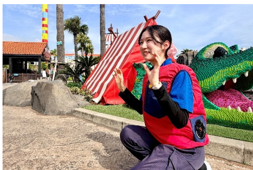
▲スタッフ着用ファンベスト