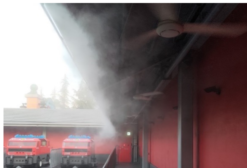
▲アトラクションに設置されたミスト