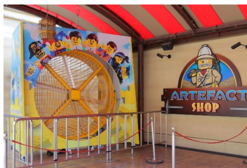
▲「アーティファクト・ショップ」前に設置された巨大ファン