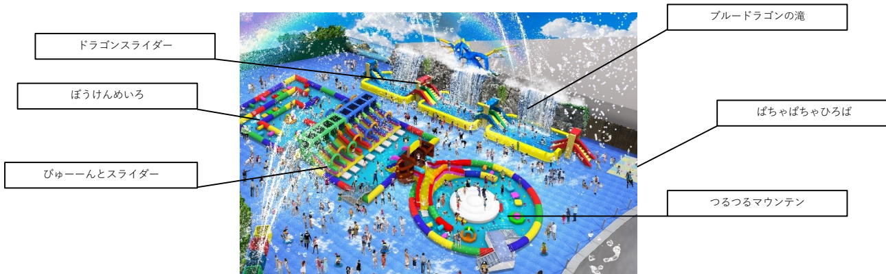
▲ウォーター・メイズⅡ エリアイメージ