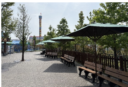
▲パーク内パラソル

また、働くスタッフの安全を守るため、定期的な水分補給やファンベストの着用、冷却アイテムの着用など、対策に努めております。