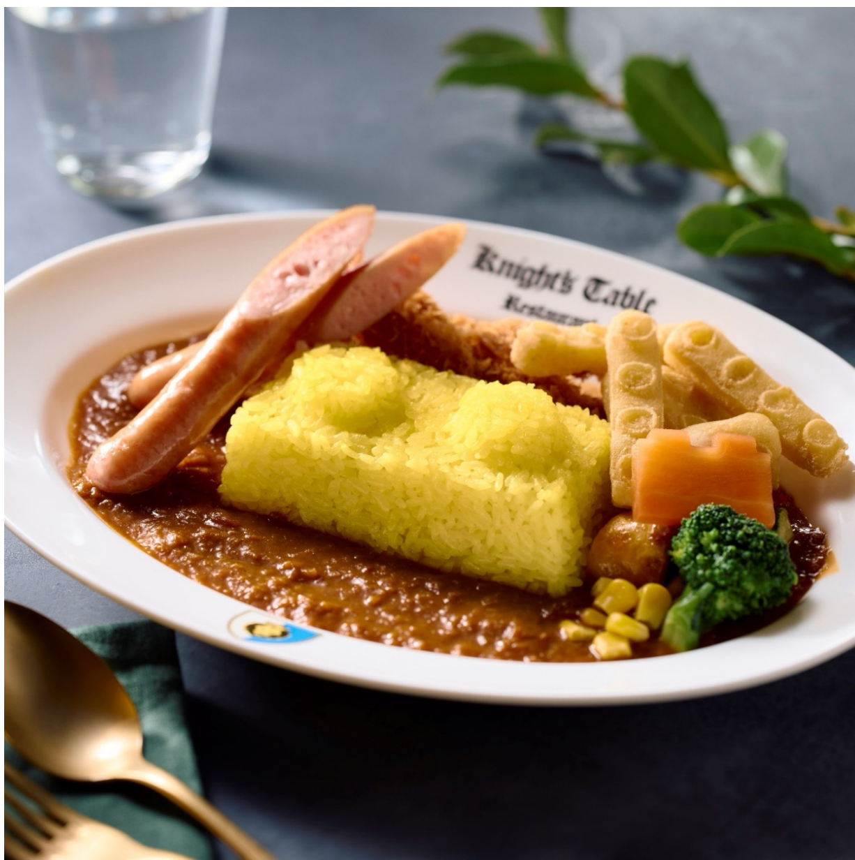
▲4種類のトッピングを乗せた、総料理長の『ひみつのカレー』 イメージ

キッズリゾートの総料理長が年に1度、レゴレナ(スタッフ)に向けて感謝デーで振る舞い、「美味しい！また食べたい！」と大好評のカレーライス。