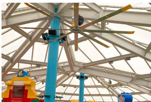
▲大型ファン/屋根付きの「デュプロ®・バレー」