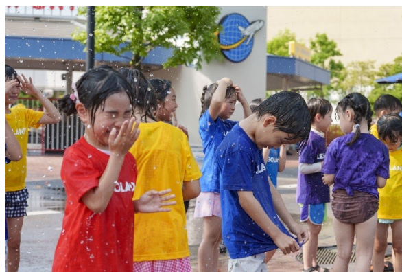
▲海賊団と灼熱(しゃ～くねつ)シャクササイズ 昨年実施時のイメージ