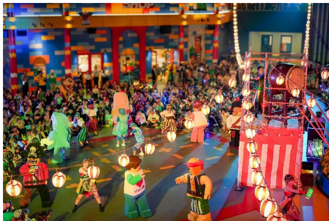
▲2025年開催時のまつりナイト・スペシャルショー イメージ