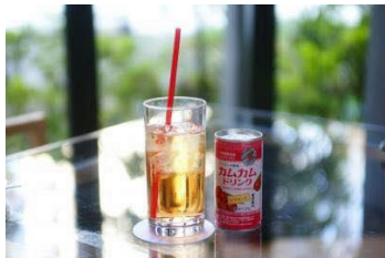
▲株式会社メルカード東京農大 大学関連商品

「(有)会津地鶏みしまや」では、キッチンカーで、独自に配合した地鶏専用の餌で育った会津地鶏を使用したからあげや、八ヶ岳の地ビールを発売いたします。その他にも、栄養と化学のプロをお呼びして、食の安全や食育についてトークショーを行う予定です。