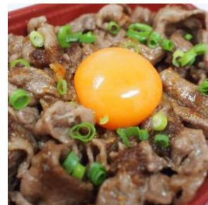
▲あわくろ屋 温泉卵のせ牛肉重