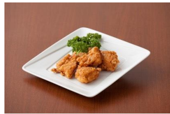
▲(有)会津地鶏みしまや からあげ