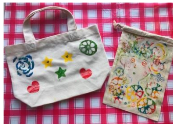
▲日本工学院学生 ワークショップ