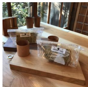
▲シフォンタイム シフォンケーキ