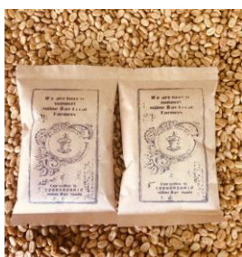
▲FARMERS CAFE TOKYO 100 アラビカシングルオリジンコーヒー

「CLR BAR」では、自然原料だけで作ったプロテインバーをご提供。栄養価が高いだけでなく、環境にも優しいナチュラルな植物性由来の原料のみを使用しています。