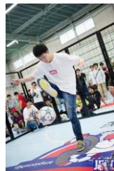
▲フリースタイルフットボーラー パフォーマンス