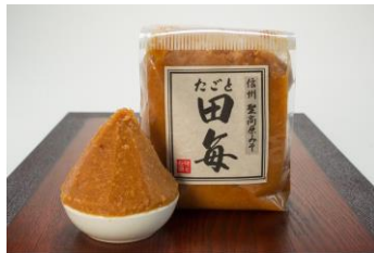
▲みそ蔵たかむら 信州味噌