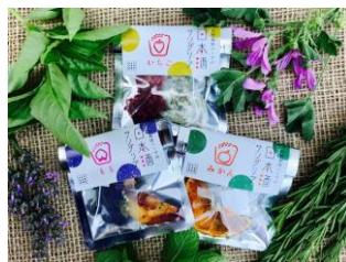
▲株式会社ポタジェ 日本酒サングリア