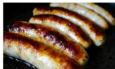
▲BARDUHN ドイツ デリカテッセン ソーセージ盛り合わせ