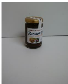
▲三重県障がい者就農促進協議会 パッションフルーツジャム

初出店の「株式会社ポタジェ」では、日本酒サングリアを発売します。日本酒に旬のフルーツを入れた大人な味のドリンクを自宅で作ることができます。