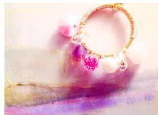
▲Olivier odorant アクセサリー