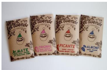
▲EL DUENDE craftchocolate チョコレート

「Olivier odorant」も今回初めて太陽のマルシェに出店。一点もののオリジナルアクセサリーを販売します。上質で軽くりズナブルでお洒落なアクセサリーが揃います。※12/8(土)のみ