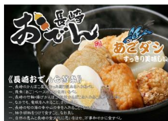
▲長崎あごだしおでん屋 おでん