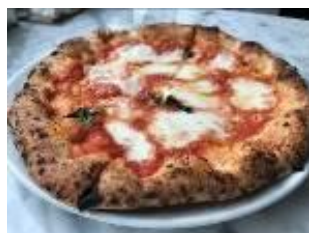
▲SOLLA PIZZA ナポリピザ