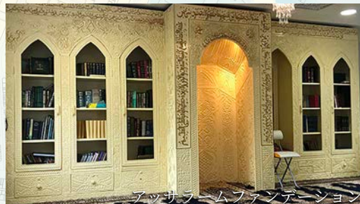
アッサラムファンデーション