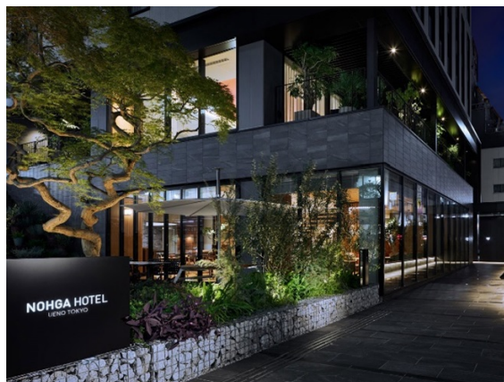
ノーガホテル上野東京

※宿泊プランは、第2部と宿泊のセットとなっています。第1部へのご参加は別途お申し込みください。