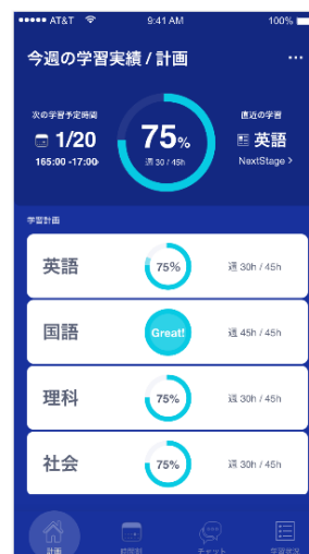
▲専用の学習管理アプリを開発 1ヶ月間、徹底伴走を行います