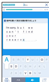
ディクテーション