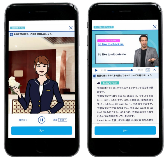
※画面はイメージです。