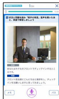
瞬間発話プラクティス