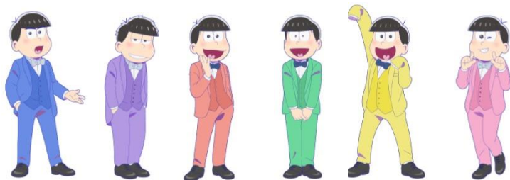
【タキシード姿の6つ子達】