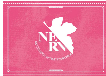
▲婚姻届の裏面は特務機関 NERV のロゴ

結婚式だけではなく、婚姻届の届出もより特別なものにしてほしいという思いから、「ピンクの婚姻届」を付録としてきた『ゼクシィ』。以来、さまざまなコラボデザインの婚姻届を作成してきましたが、今回はエヴァンゲリオン仕様の婚姻届が登場します。結婚を決意したおふたりはこの婚姻届を使い、エヴァンゲリオンとパイロットのような高いシンクロ率を目指してみるのはいかがでしょうか？