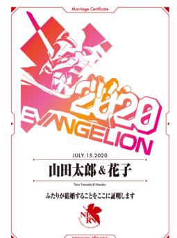
▲ウエルカムボードイメージ

さらに、今回は「エヴァンゲリオン婚姻届 2020」の製作を記念して、世界に一つだけの「エヴァンゲリオン オリジナルウエルカムボード」も作成。『ゼクシィ』公式 Twitter で出題されるクイズに解答いただき、正解された方の中から抽選で1名様に、ふたりの名前と挙式の日付が入ったこちらのウエルカムボードをプレゼントいたします。ぜひパートナーと一緒に考えてご応募下さい。