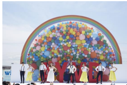
▲挙式の新郎新婦と友人らによるダンス