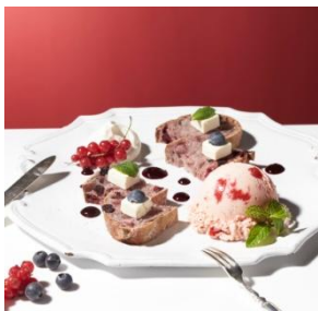
ブルーベリーリュスティック with “ストロベリー” 1,200円 (セット：1,400円)

クッキー&クリームアイスクリームと熱々のブラウニーの2つの濃厚な味わいを組み合わせ、ベリーとアプリコットソースで爽やかに仕上げました。