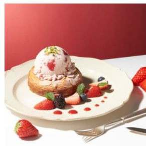
デニッシュ with “ストロベリー” 1,100円 (セット：1,300円)

バター風味豊かなデニッシュにカラメルソースをコーティングしたクイニアマンで、バニラアイスクリームをぜいたくに挟みました。リンゴのソーテーが2つの味を引き立てます。