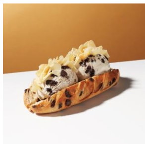
ヴィエノワーズショコラ with “クッキー&クリーム” 600円

カカオのほろ苦さと中はモチモチ・外はカリカリの口当たり。コク深いマカデミアナッツアイスクリームに合わせて、隠し味に香り広がるココナッツを増量した特別なレシピのパンでお届けします。