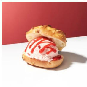
デリスブラン with “ストロベリー” 600円

濃厚なバニラアイスクリームをレモンピールの香り広がるプリオッシュにのせ、ザクザクのクロワッサンの帽子をかぶせました。