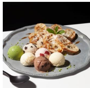
バゲットモンジュ with Häagen-Dazs 1,300円 (セット：1,500円)

ブルーベリーを練り込んだしっとりモチモチの天然酵母パンと果肉たっぷりのストロベリーアイスクリームの2つの甘酸っぱさが広がります。ベリーと相性のいいクリームチーズとピスタチオを添えて。