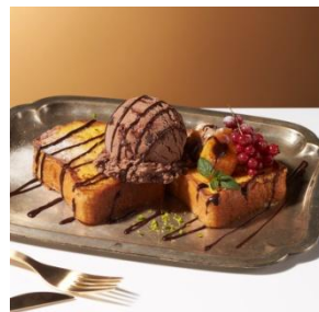
フレンチトースト with “チョコレートブラウニー” 1,300円 (セット：1,500円)

しっとりふわふわ焼きたてのフレンチトーストに、ローストバナナとチョコレートブラウニーアイスクリームの濃厚でコクのある味わいが広がります。