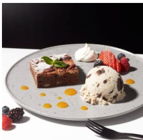
ホットブラウニー with “クッキー&クリーム” 1,000円 (セット：1,200円)

しっとりふわふわ焼きたてのフレンチトーストに、ローストバナナとチョコレートブラウニーアイスクリームの濃厚でコクのある味わいが広がります。