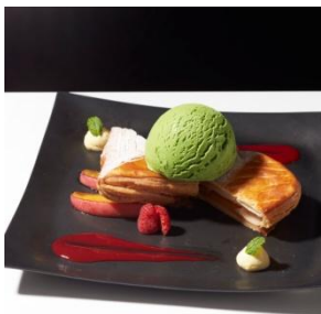
ショソンオボム with “グリーンティー” 1,300円 (セット：1,500円)

カスタードクリームを包んで焼き上げた香ばしいデニッシュの上に、イチゴソースと香り豊かなストロベリーアイスクリームをのせました。重なり合う甘酸っぱさが口の中でとろける一品です。