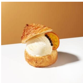
クロワッサンハット with “バニラ” 600円

濃厚なバニラアイスクリームをレモンピールの香り広がるプリオッシュにのせ、ザクザクのクロワッサンの帽子をかぶせました。