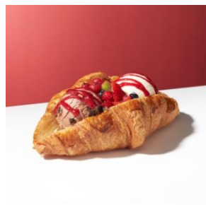
クロワッサン with “バニラ”&“チョコレートブラウニー” 600円

チョコレートチップを練り込んだパンに食感の楽しいクッキー&クリームアイスクリームを挟み、上から香ばしいローストアーモンドをぜひたくに盛り付けました。