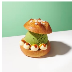
プチプリオッシュシュクル with “グリーンティー” 600円

ホワイトチョコレートを練り込んだ人気のデリスブランに香り豊かなストロベリーアイスクリームの甘酸っぱさが口に広がります。