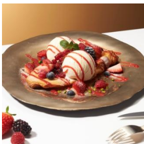
クロワッサンオザマンド with “バニラ” 1,300円 (セット：1,500円)

ラムシロップに漬け、香ばしいアーモンドクリームを挟み焼き上げたクロワッサンに濃厚なバニラアイスクリームが絡み合います。最後にベリーもふんだんに盛り付けて。