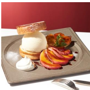
クイニアマン with “バニラ” 1,000円 (セット：1,200円)

ラムシロップに漬け、香ばしいアーモンドクリームを挟み焼き上げたクロワッサンに濃厚なバニラアイスクリームが絡み合います。最後にベリーもふんだんに盛り付けて。