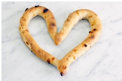
-ハートのホワイトバゲット- 320円(税別)