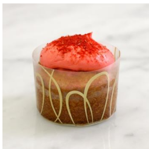
-マフィンフレーズ- 290円(税別)

爽やかなチョコミントクリームをちょっぴり ビターなチョコレートマフィンに合わせまし た。