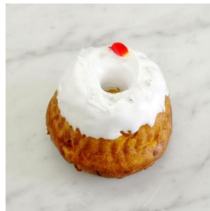
-アムールブラン- 450円(税別)

ドライアップルの果肉が入った生地 にレモン風味のアイシングで、程よい酸味 がアクセントになった一品です。