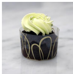
-マフィンチョコミント- 290円(税別)

黄桃とホワイトチョコレートのデニッ シュです。中には抹茶のクリームが入っ ています。