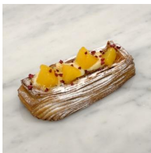
-黄桃とホワイトチョコのデニッシュ- 390円(税別)

ドライアップルの果肉が入った生地 にレモン風味のアイシングで、程よい酸味 がアクセントになった一品です。