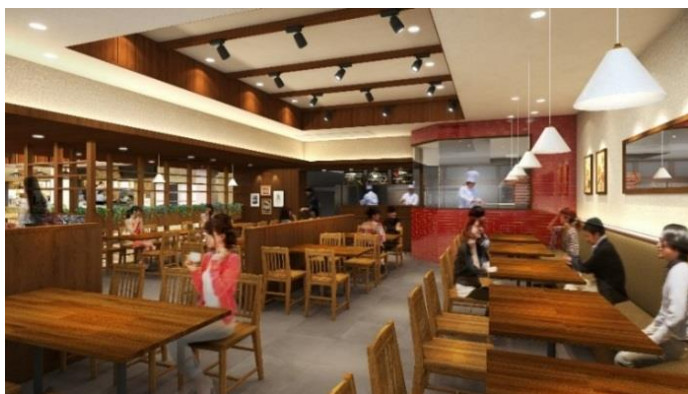
《レストラン イメージ》