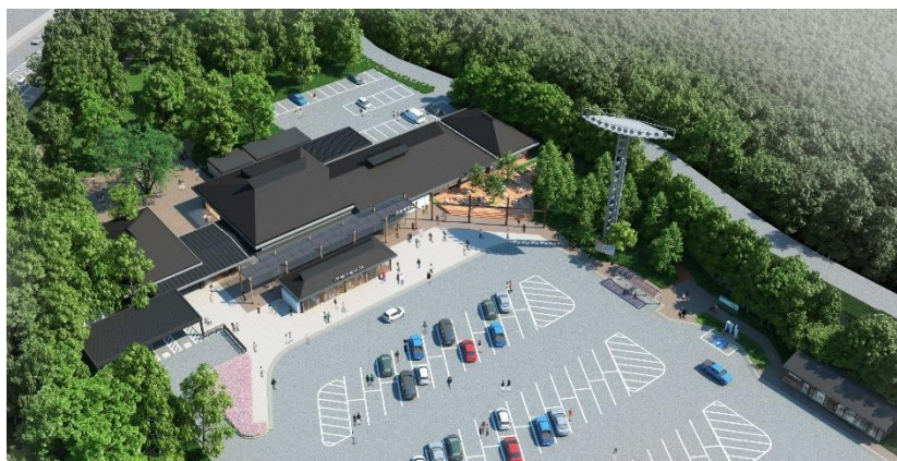
《俯瞰外観イメージ(グランドオープン 平成30年4月下旬予定)》