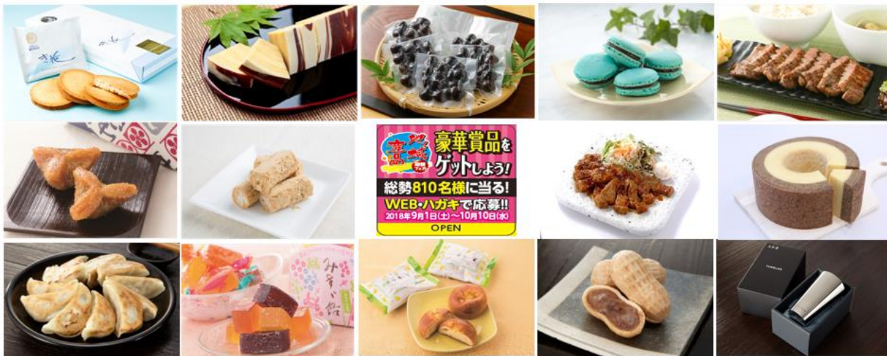
対象商品一例(表示順)