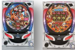
CR奇跡の電役 キャプテンロバート CRナナシービッグF