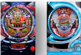
CR大シャカRUSH CRリルシャリターンズ

※その他、CRAスーパーセゾンファイアプレー、 CR動太とまつりの連発花火など多数登場!