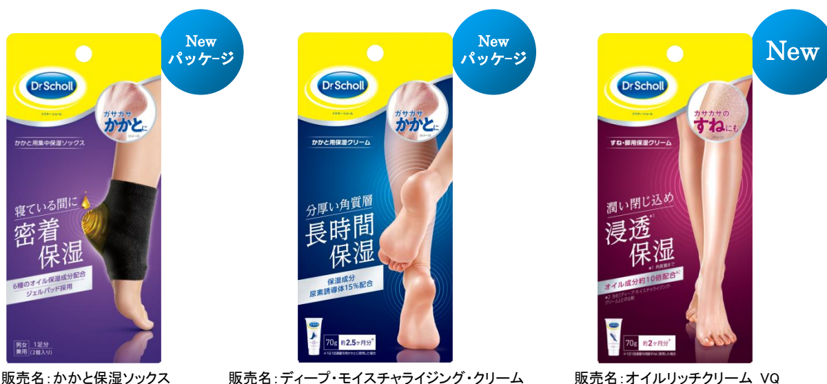
販売名: かかと保湿ソックス

レキットベンキーザー・ジャパン株式会社(本社:東京都品川区東五反田/代表取締役:シャイレツシュ・シユクラ)は、世界100カ国以上で愛されるフット&レッグケア商品の総合ブランド『ドクター・ショール』より、かかと&すねの保湿ケアのスキンケアラインナップとして、新商品「すね・脚用保湿クリーム」および、パッケージリニューアル商品「かかと用保湿クリーム」「かかと用集中保湿ソックス」の3種を2019年9月2日(月)より順次店頭販売開始いたします。